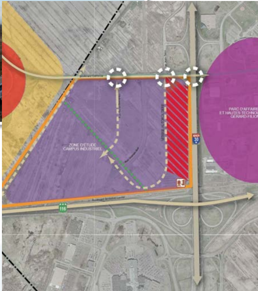
Schéma d'aménagement et de développement révisé

MRC DE L'ASSOMPTION 300-A, rue Dorval L'Assomption (Qc) J5W 3A1