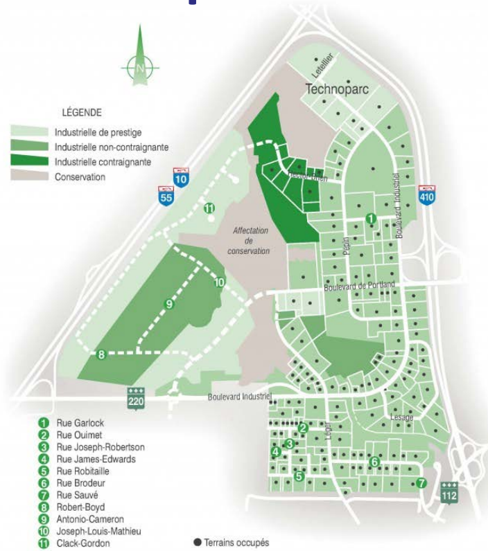
Parc industriel régional de Sherbrooke